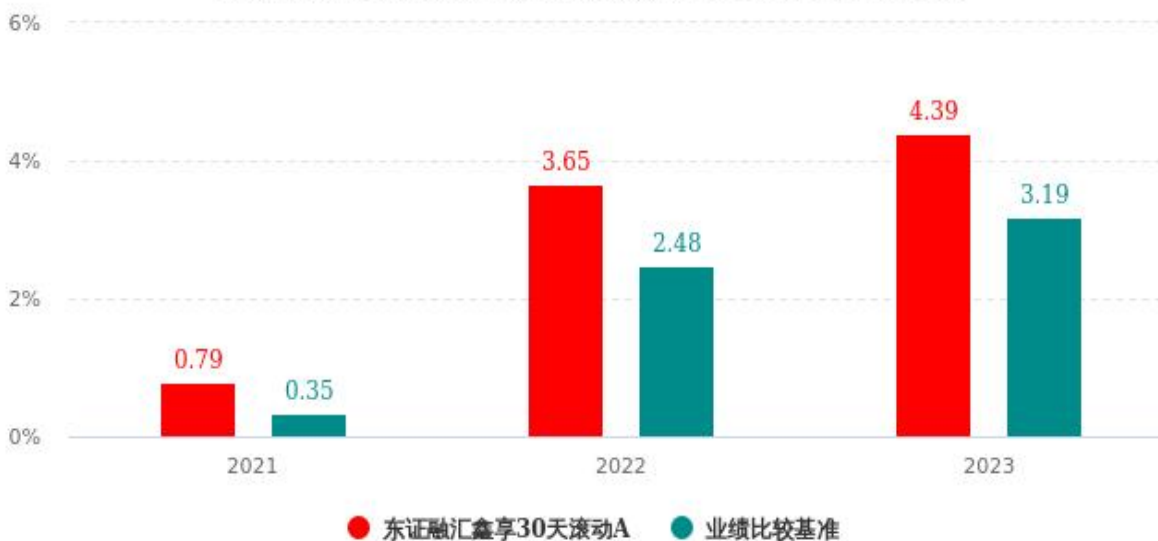
基金的过往业绩不代表未来表现，数据截止日：2023年12月31日