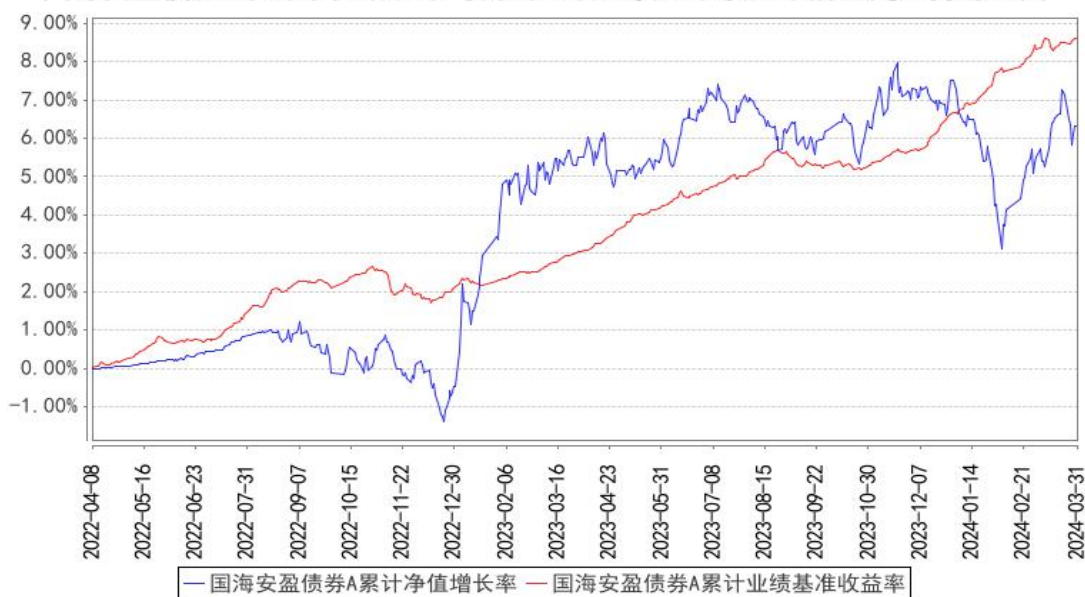
国海安盈债券A累计净值增长率与同期业绩比较基准收益率的历史走势对比图