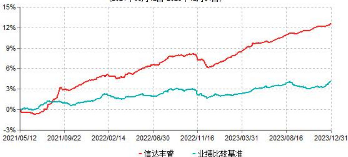
信达丰睿六个月持有期债券型集合资产管理计划累计净值增长率与业绩比较基准收益率历史走势对比图 (2021年05月12日-2023年12月31日)