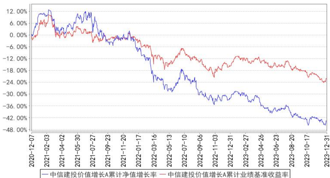
中信建投价值增长A累计净值增长率与同期业绩比较基准收益率的历史走势对比图