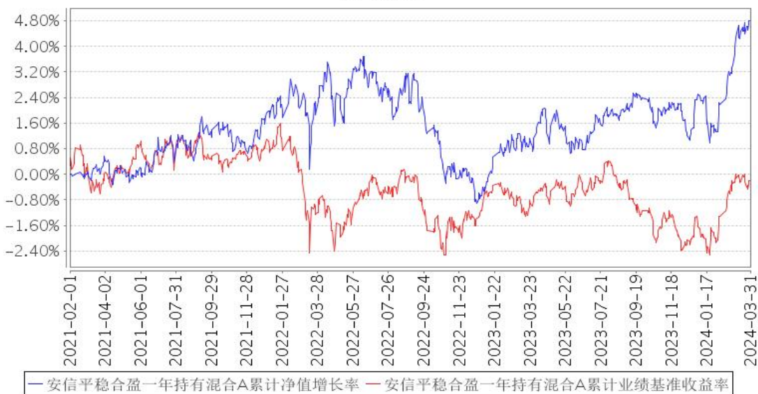
安信平稳合盈一年持有混合A累计净值增长率与同期业绩比较基准收益率的历史走势对比图