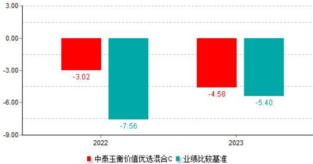
基金的过往业绩不代表未来表现，数据截止日：2023年12月31日 单位%

注：本基金自2022年7月1日起增设C类基金份额，增设C类基金份额当年不满完整自然年度，按实际期限（2022年7月1日-2022年12月31日）计算净值增长率。