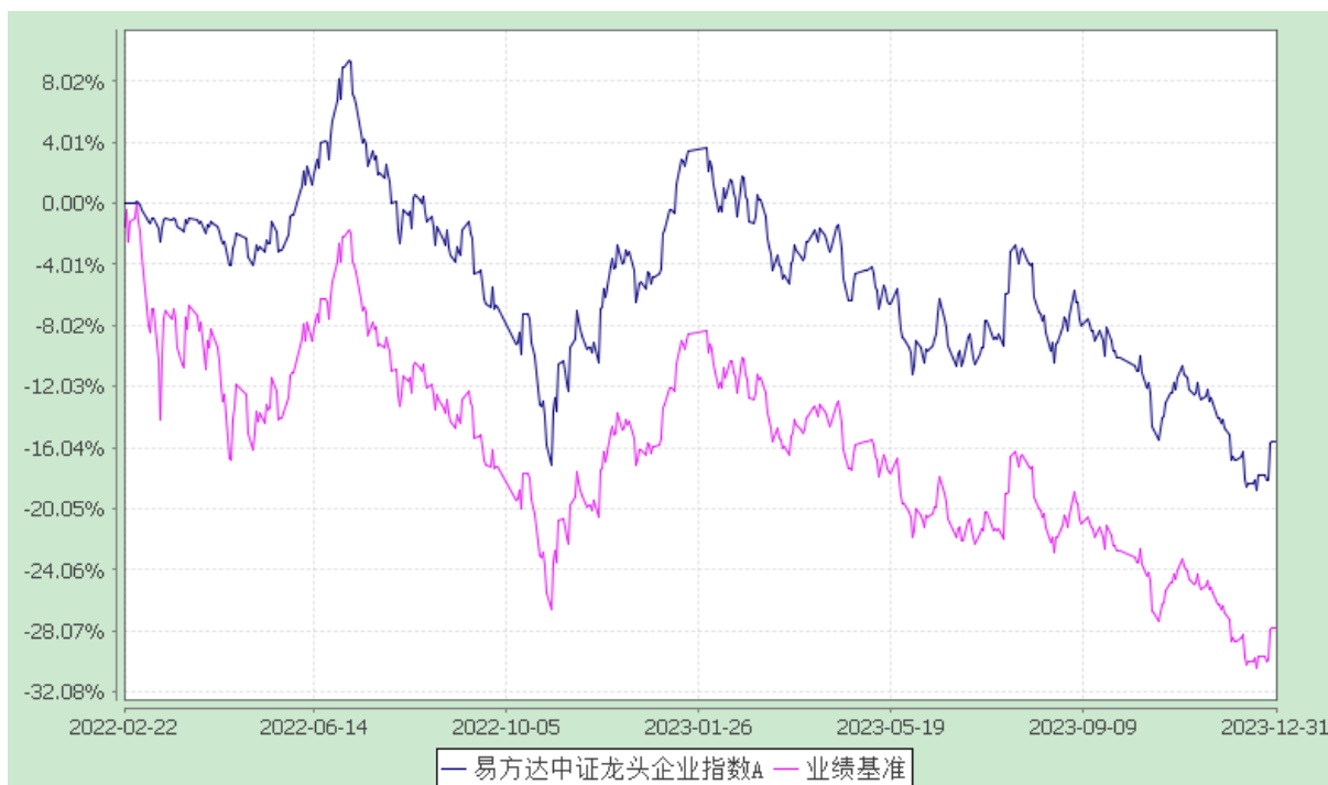
易方达中证龙头企业指数 C