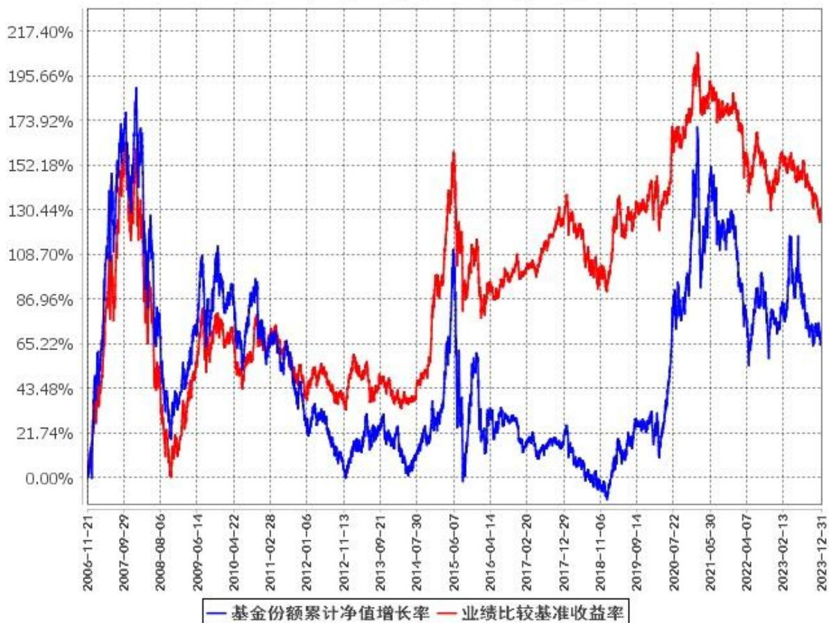
基金份额累计净值增长率与同期业绩比较基准收益率的历史走势对比图 (2006年11月21日至2023年12月31日)