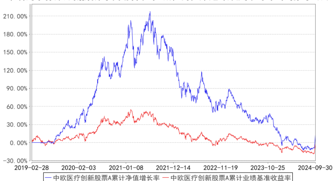
中欧医疗创新股票A累计净值增长率与同期业绩比较基准收益率的历史走势对比图