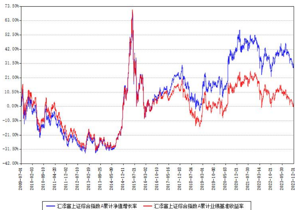
汇添富上证综合指数A累计净值增长率与同期业绩基准收益率对比图