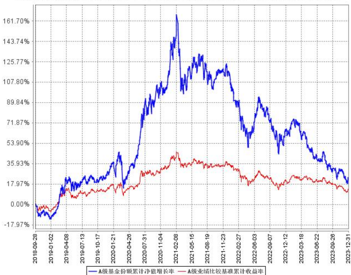
A 级基金份额累计净值增长率与同期业绩比较基准收益率的历史走势对比图