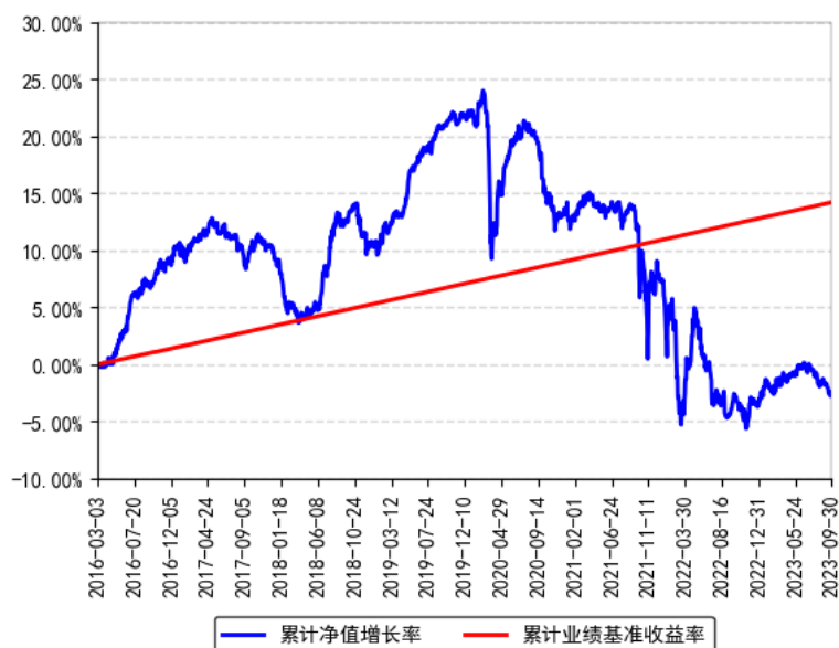
南方亚洲美元收益债券 (QDII) A (人民币) 累计净值增长率与同期业绩比较基准收益率的历史走势对比图