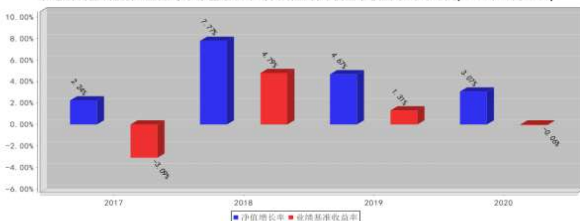
泰达宏利恒利债券A基金每年净值增长率与同期业绩比较基准收益率的对比图(2020年12月31日)

注：本基金合同生效日为2017年1月22日，2017年度净值增长率的计算期间为2017年1月22日至2017年12月31日。基金的过往业绩不代表未来表现。