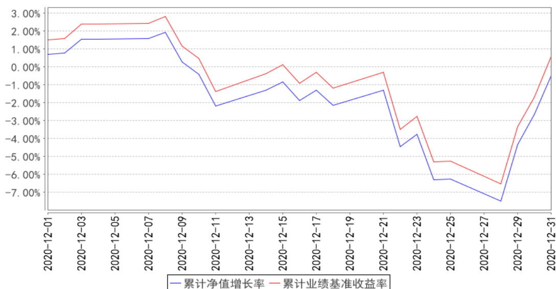
融通中证云计算与大数据主题指数（LOF）累计净值增长率与同期业绩比较基准收益率的历史走势对比图

注：本基金转型后的基金合同生效日为 2020 年 12 月 1 日，至报告期末基金转型未满一年。