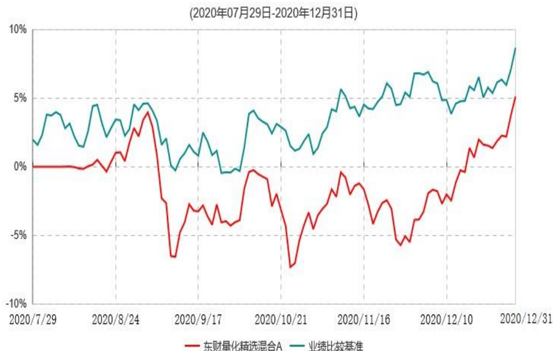
东财量化精选混合A累计净值增长率与业绩比较基准收益率历史走势对比图