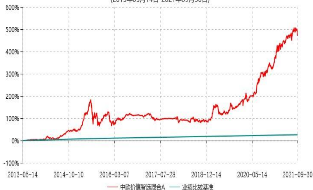
中欧价值智选混合A累计净值增长率与业绩比较基准收益率历史走势对比图 (2013年05月14日-2021年09月30日)