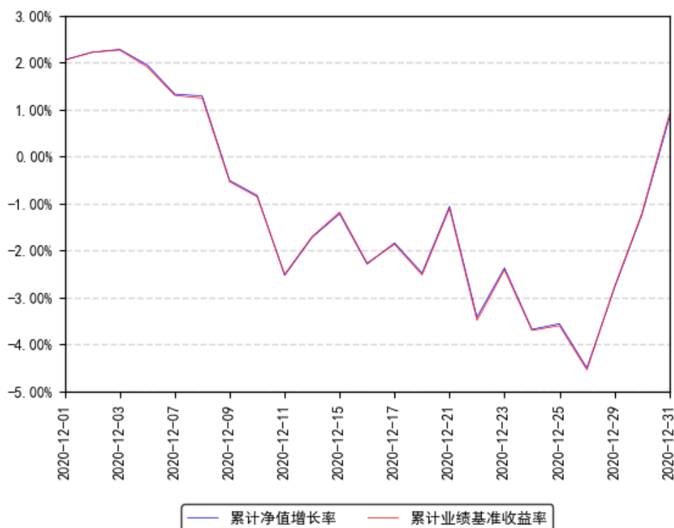
南方中证互联网指数累计净值增长率与同期业绩比较基准收益率的历史走势对比图

注：本基金转型日期为2020年12月1日，本基金合同于2020年12月1日生效，截至本报告期末基金成立未满一年；自基金成立日起6个月内为建仓期，截至报告期末基金尚未完成建仓。