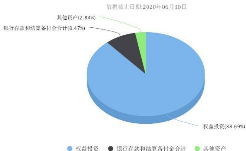
汇添富中证生物科技指数（LOF）A投资组合资产配置图表