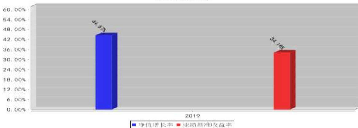
泰达宏利沪深300C基金每年净值增长率与同期业绩比较基准收益率的对比图(2019年12月31日)

注：本基金转型之日为 2018 年 3 月 16 日，2018 年度净值增长率的计算期间为 2018 年 3 月 16 日至 2018 年