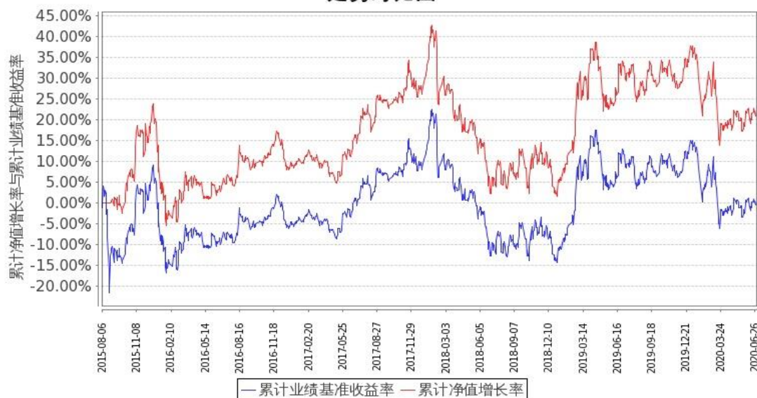
图1：嘉实中证金融地产ETF联接A基金份额累计净值增长率与同期业绩比较基准收益率的历史走势对比图 (2015年8月6日至2020年6月30日)