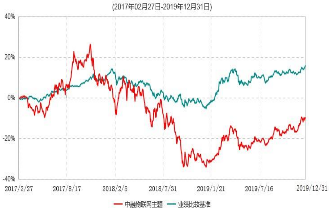
中融物联网主题灵活配置混合型证券投资基金累计净值增长率与业绩比较基准收益率历史走势对比图

注：按基金合同和招募说明书的约定，本基金自基金合同生效日起6个月内为建仓期，建仓期结束时本基金的各项投资比例符合基金合同的有关约定。