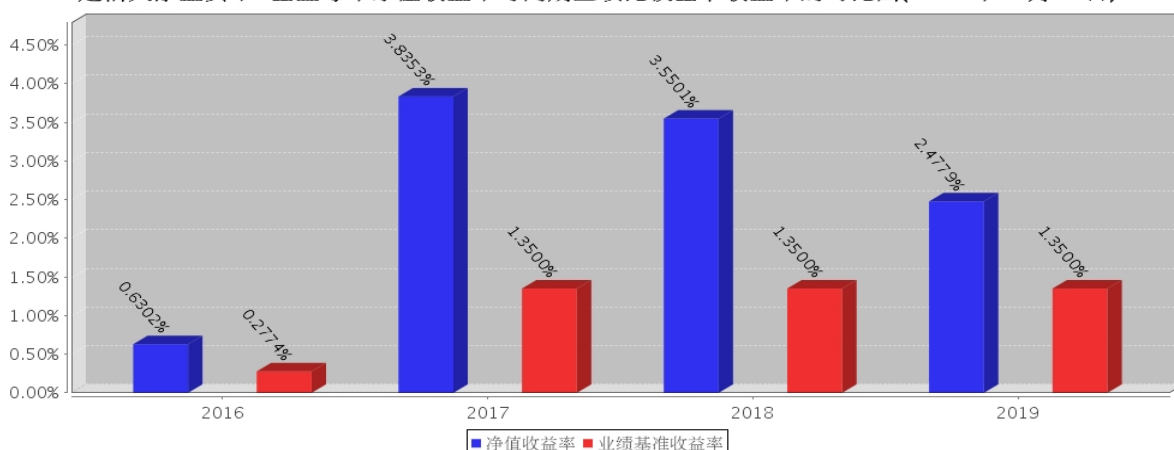
建信天添益货币B基金每年净值收益率与同期业绩比较基准收益率的对比图(2019年12月31日)