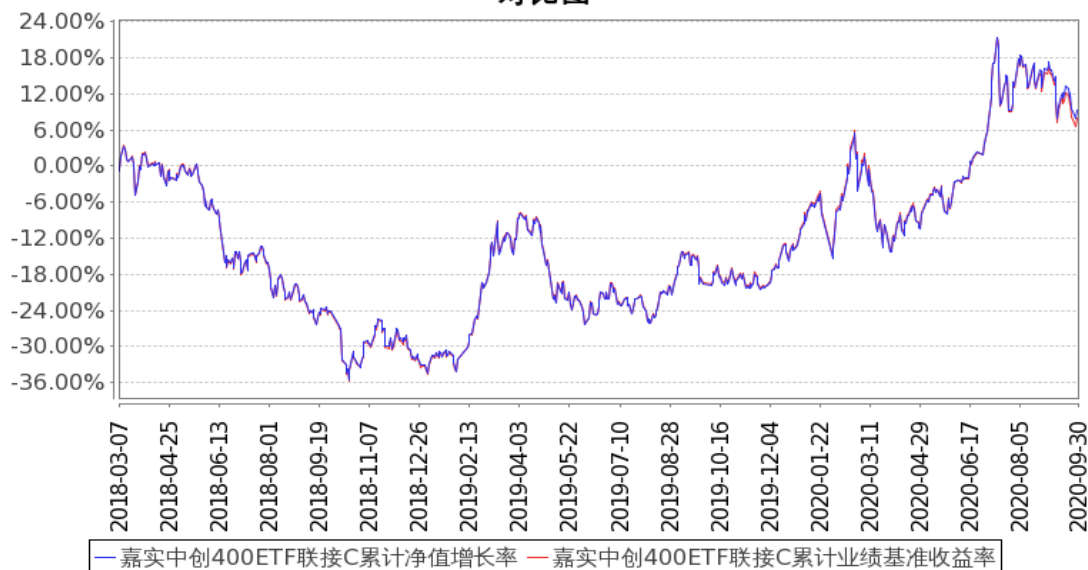
嘉实中创400ETF联接C累计净值增长率与同期业绩比较基准收益率的历史走势对比图