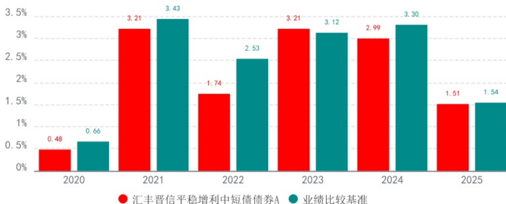
基金的过往业绩不代表未来表现，数据截止日：2025年12月31日

注：本基金的基金合同于2020年11月19日生效，本基金基金合同生效当年按实际存续期计算，不按整个自然年度进行折算。