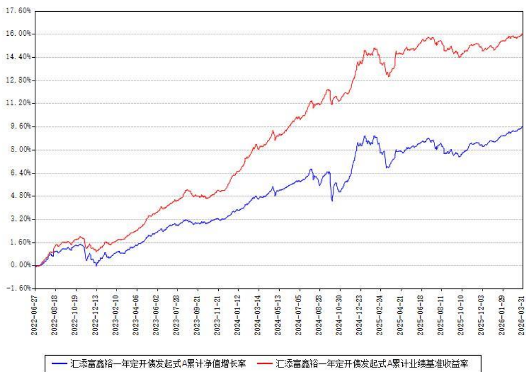
汇添富鑫裕一年定开债发起式A累计净值增长率与同期业绩基准收益率对比图