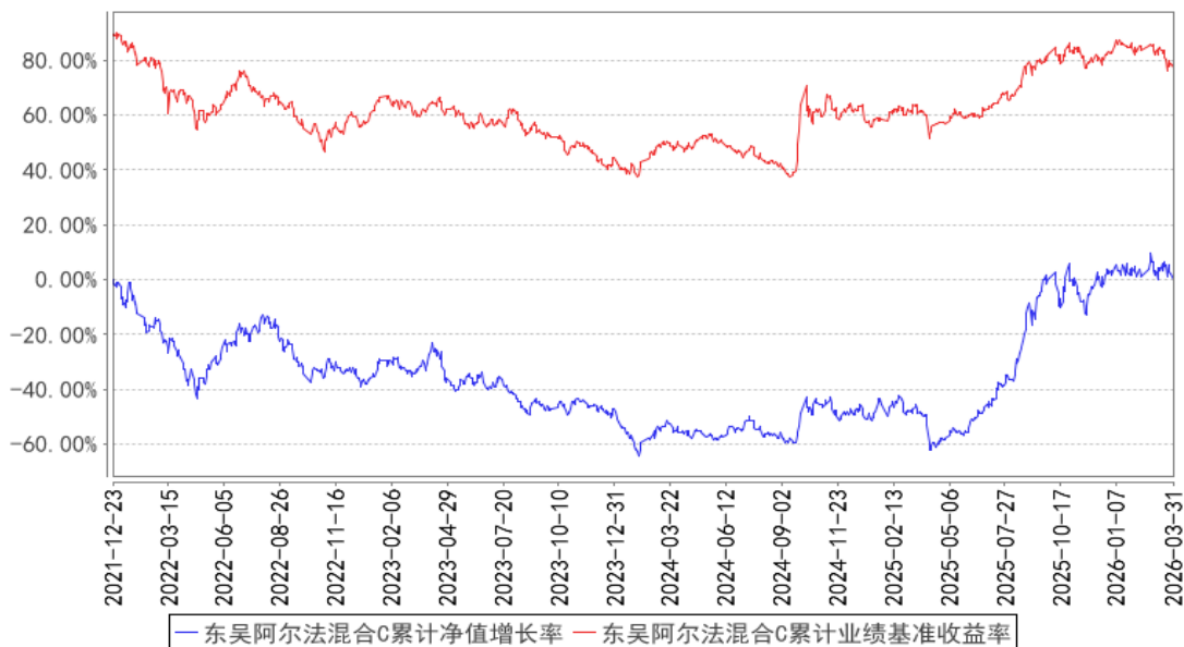
东吴阿尔法混合C累计净值增长率与同期业绩比较基准收益率的历史走势对比图