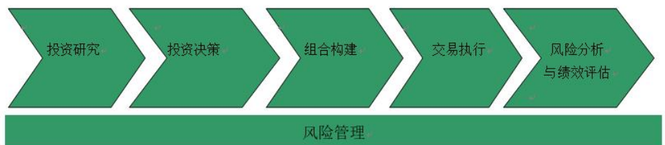
图 1 投资管理流程