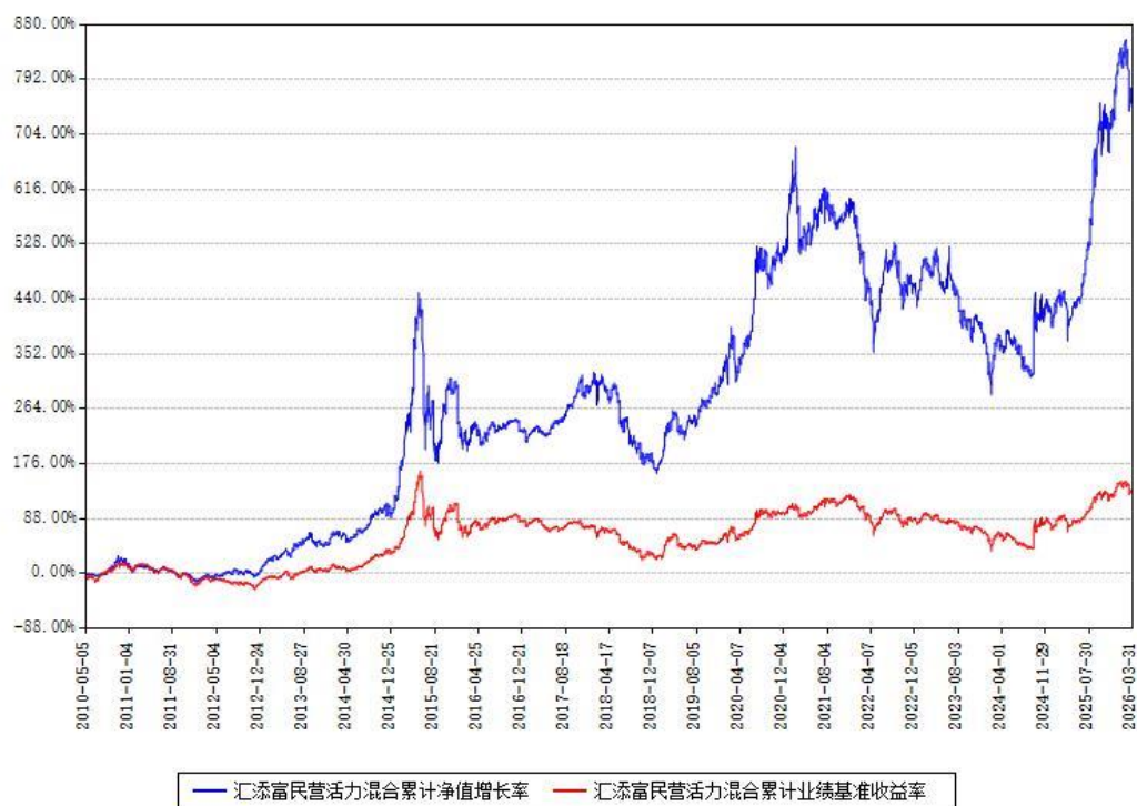
汇添富民营活力混合累计净值增长率与同期业绩基准收益率对比图

(二)自基金合同生效以来基金累计净值增长率变动及其与同期业绩比较基准收益率变动的比较图