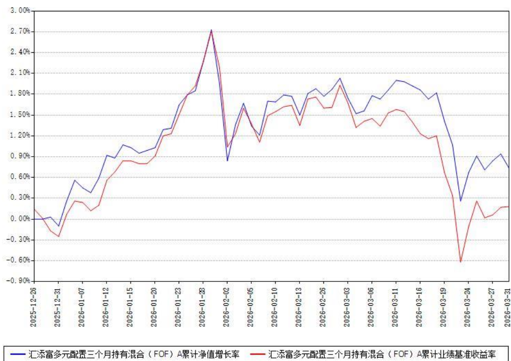
汇添富多元配置三个月持有混合（FOF）C累计净值增长率与同期业绩基准收益率对比图