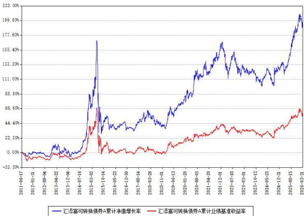
汇添富可转换债券C累计净值增长率与同期业绩基准收益率对比图