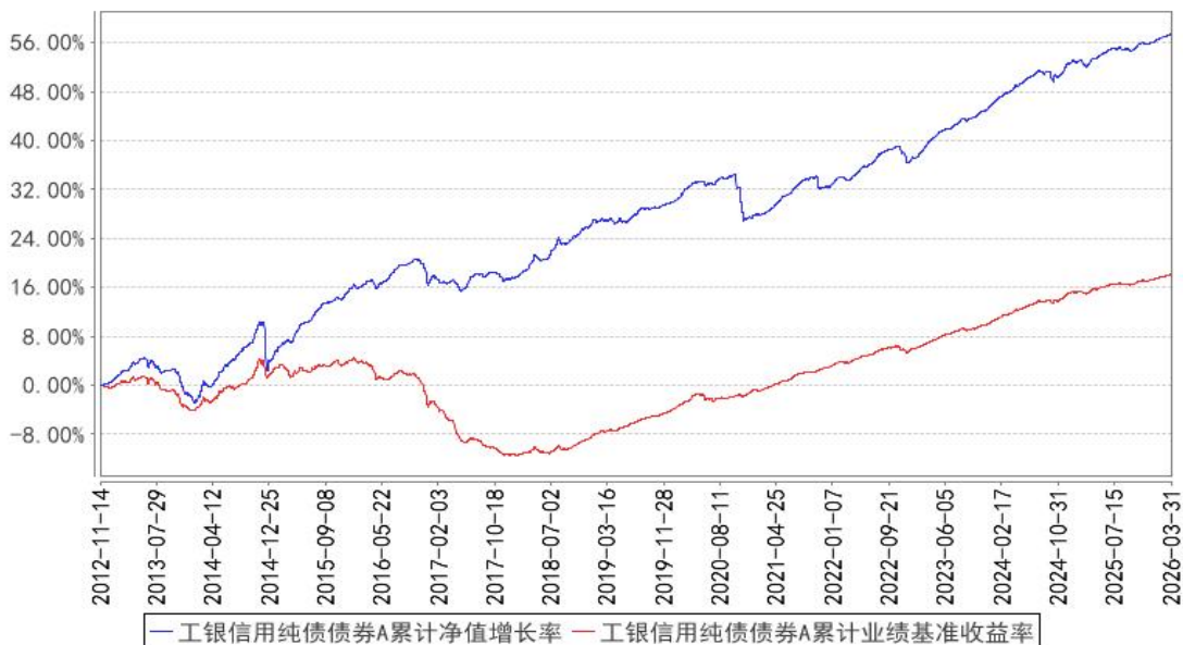
工银信用纯债债券A累计净值增长率与同期业绩比较基准收益率的历史走势对比图