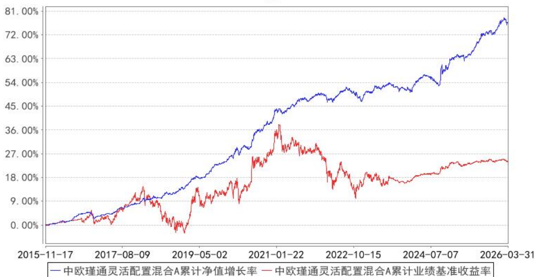
中欧瑾通灵活配置混合A累计净值增长率与同期业绩比较基准收益率的历史走势对比图

注：“自 2016 年 9 月 5 日起，业绩比较基准由金融机构人民币三年期定期存款基准利率（税后）变更至沪深 300 指数收益率*50%+中债综合指数收益率*50%。2023 年 8 月 8 日起组合业绩比较基准变更为中债综合指数收益率*85%+沪深 300 指数收益率*10%+银行活期存款利率（税后）*5%。”