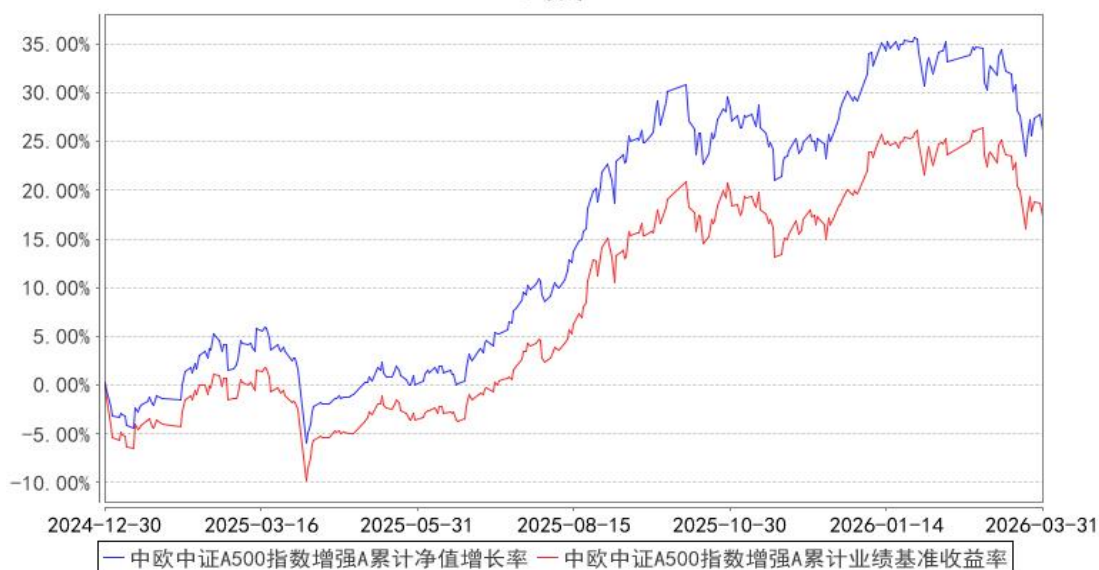
中欧中证A500指数增强A累计净值增长率与同期业绩比较基准收益率的历史走势对比图