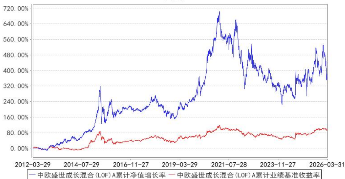
中欧盛世成长混合 (LOF) A 累计净值增长率与同期业绩比较基准收益率的历史走势对比图