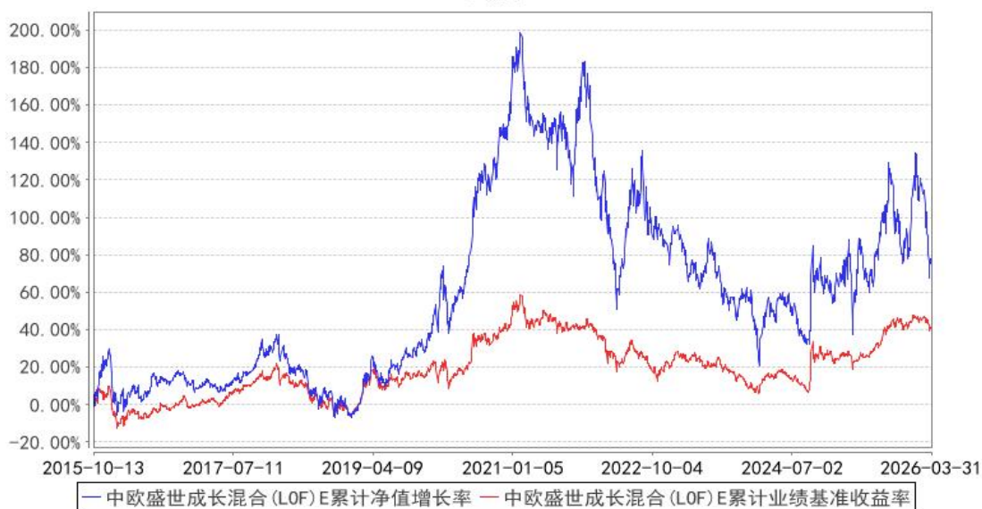
中欧盛世成长混合 (LOF) E 累计净值增长率与同期业绩比较基准收益率的历史走势对比图

注：本基金于 2015 年 10 月 8 日新增 E 份额，图示日期为 2015 年 10 月 13 日至 2026 年 03 月 31 日。