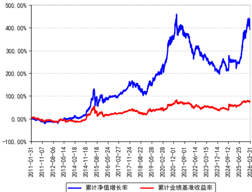
南方优选成长混合A累计净值增长率与同期业绩比较基准收益率的历史走势对比图