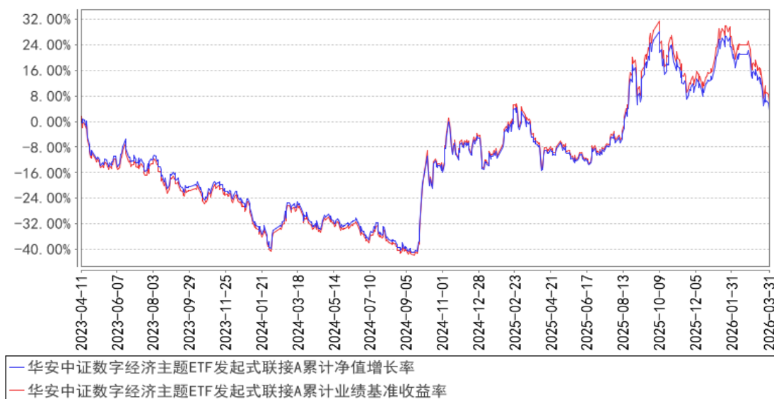
华安中证数字经济主题ETF发起式联接A累计净值增长率与同期业绩比较基准收益率的历史走势对比图