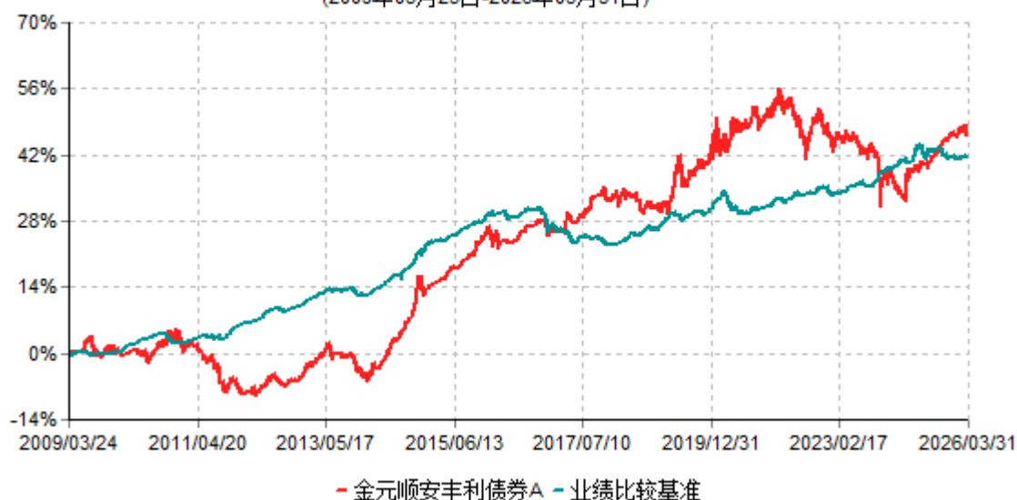
金元顺安丰利债券A累计净值增长率与业绩比较基准收益率历史走势对比图 (2009年03月23日-2026年03月31日)