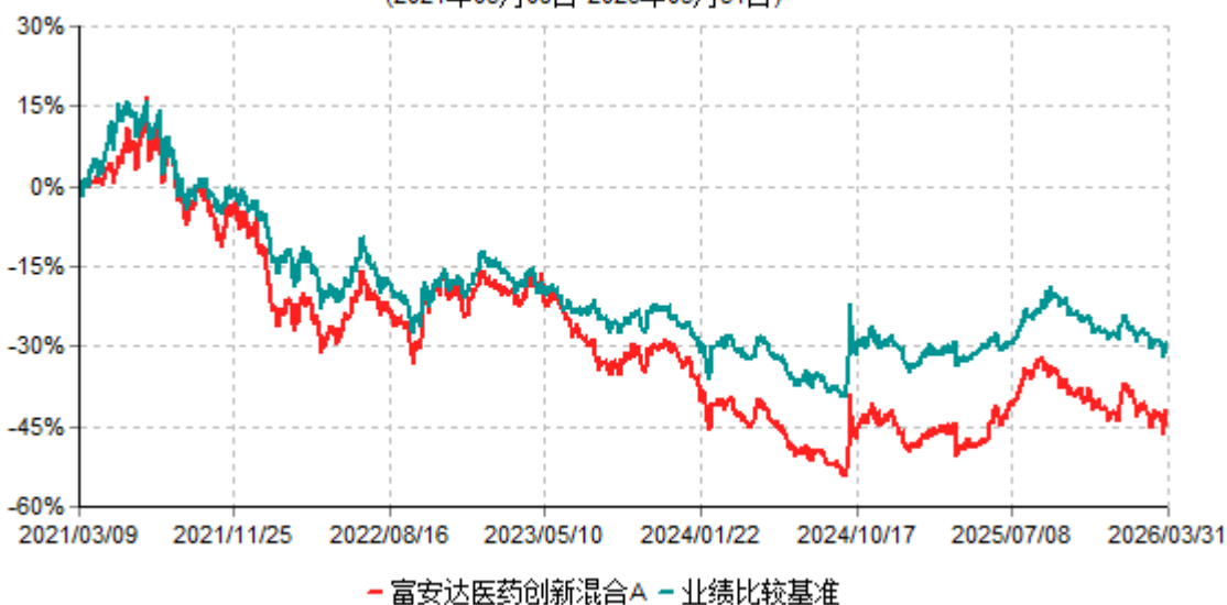
富安达医药创新混合A累计净值增长率与业绩比较基准收益率历史走势对比图 (2021年03月09日-2026年03月31日)