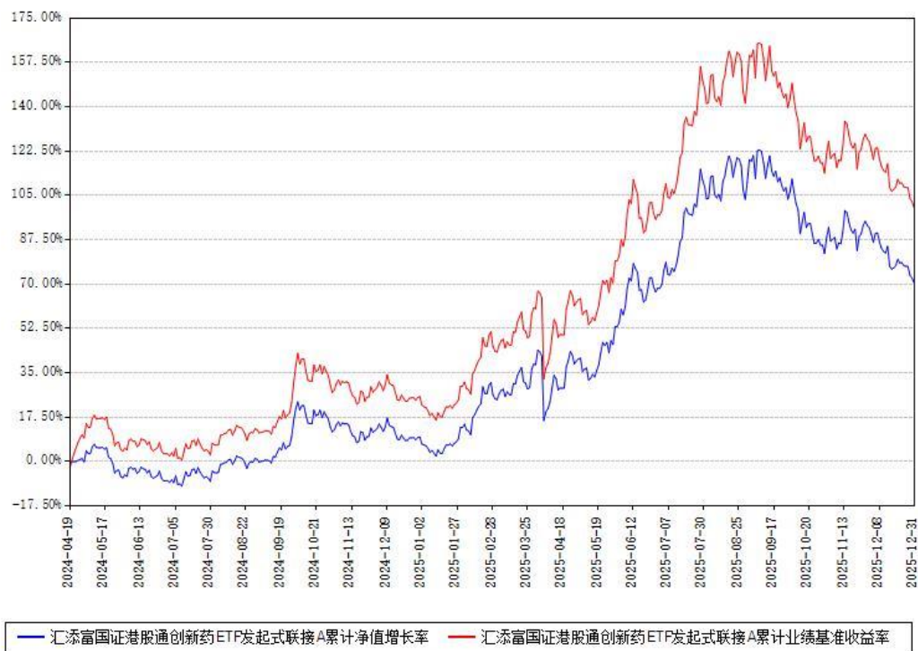
汇添富国证港股通创新药ETF发起式联接A累计净值增长率与同期业绩基准收益率对比图