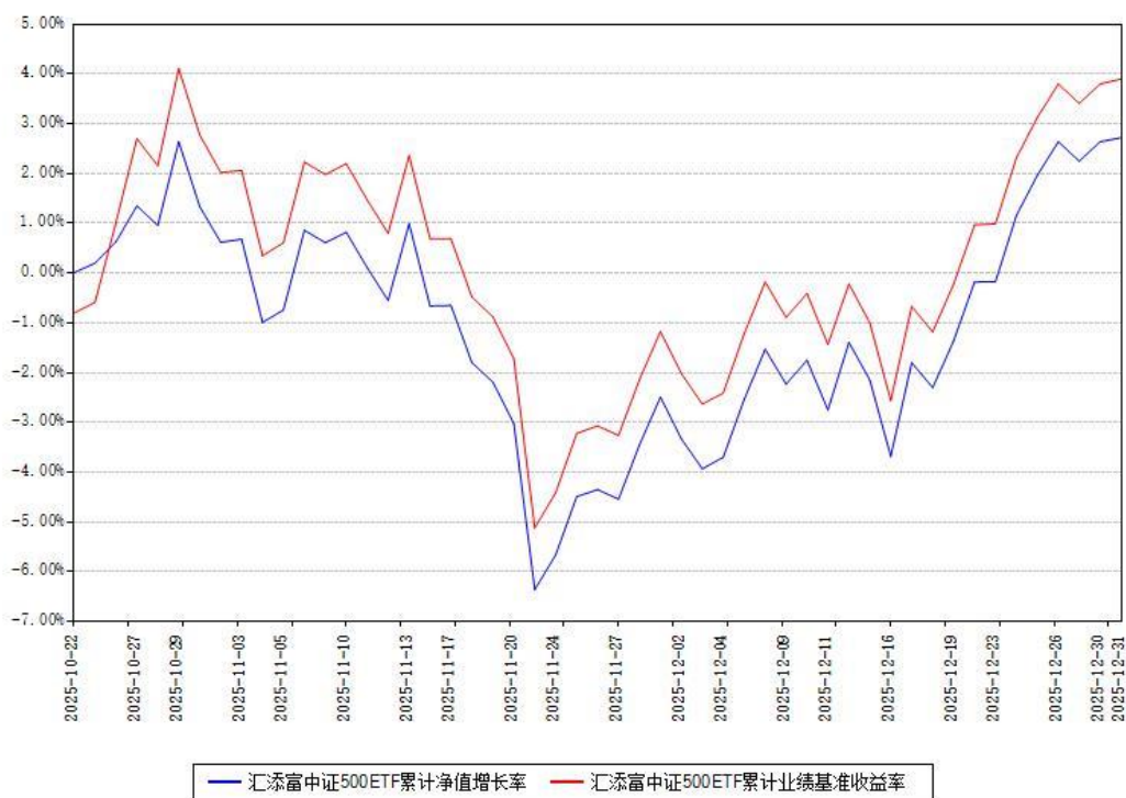
汇添富中证500ETF累计净值增长率与同期业绩基准收益率对比图

注：本《基金合同》生效之日为 2025 年 10 月 22 日，截至本报告期末，基金成立未满一年。本基金建仓期为本《基金合同》生效之日起 6 个月，截至本报告期末，本基金尚处于建仓期中。