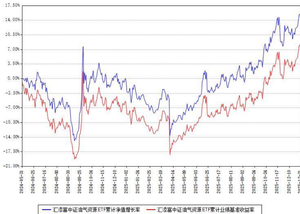
汇添富中证油气资源ETF累计净值增长率与同期业绩比较基准收益率对比图

注：本基金建仓期为本《基金合同》生效之日（2024年05月31日）起6个月，建仓期结束时各项资产配置比例符合合同约定。