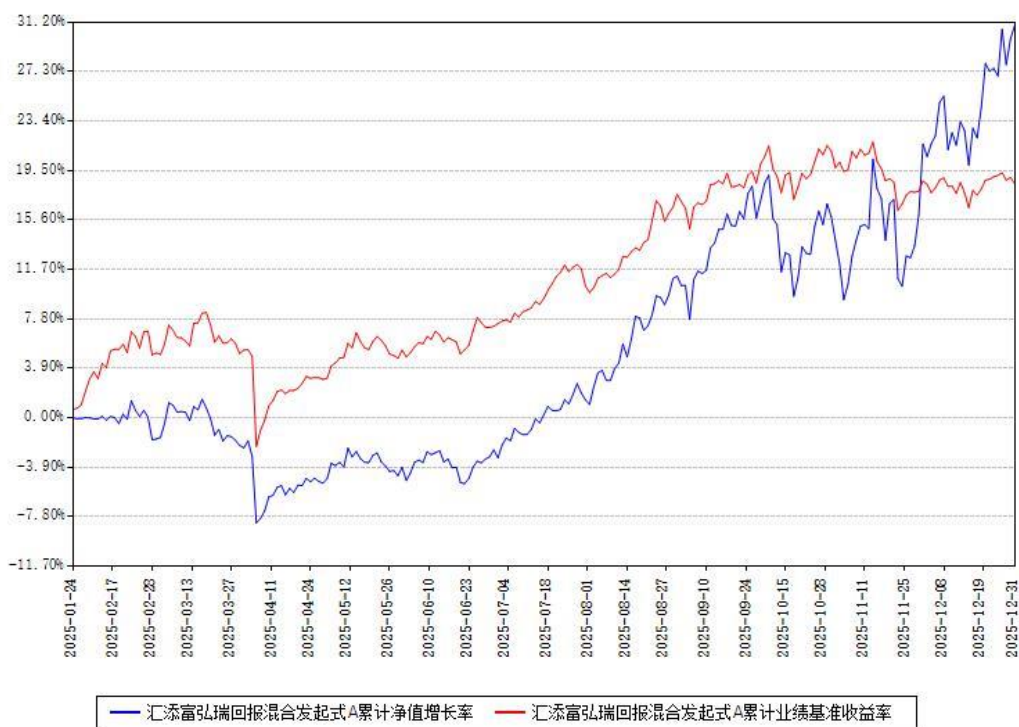
汇添富弘瑞回报混合发起式A累计净值增长率与同期业绩基准收益率对比图