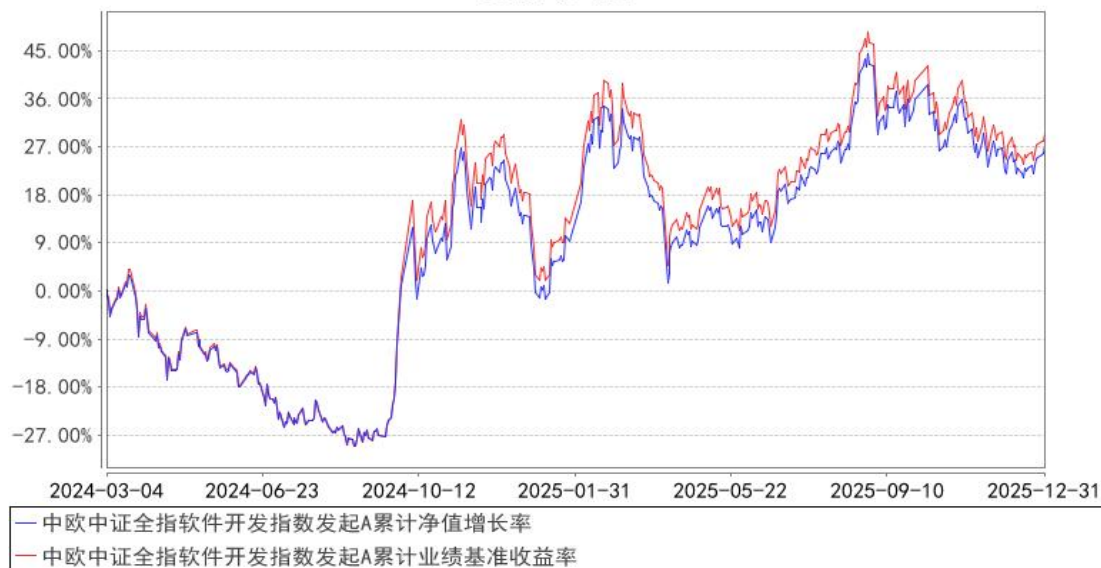
中欧中证全指软件开发指数发起A累计净值增长率与同期业绩比较基准收益率的历史走势对比图