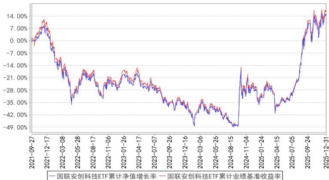
国联安创科技ETF累计净值增长率与同期业绩比较基准收益率的历史走势对比图

注：1、本基金业绩比较基准为创业板科技指数收益率； 2、本基金基金合同于 2021 年 9 月 27 日生效； 3、本基金建仓期为自基金合同生效之日起的 6 个月。建仓期结束时各项资产配置符合合同约定。