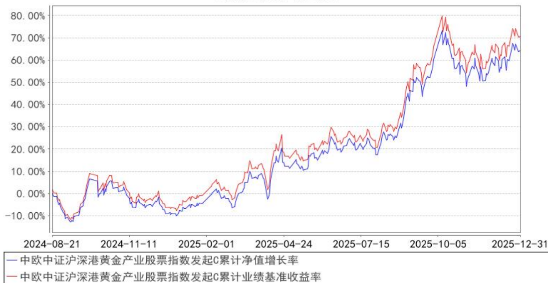
中欧中证沪深港黄金产业股票指数发起C累计净值增长率与同期业绩比较基准收益率的历史走势对比图

注：本基金基金合同生效日期为 2024 年 8 月 21 日，按基金合同的规定，本基金自基金合同生效起六个月为建仓期，建仓期结束时各项资产配置比例已经符合基金合同约定。