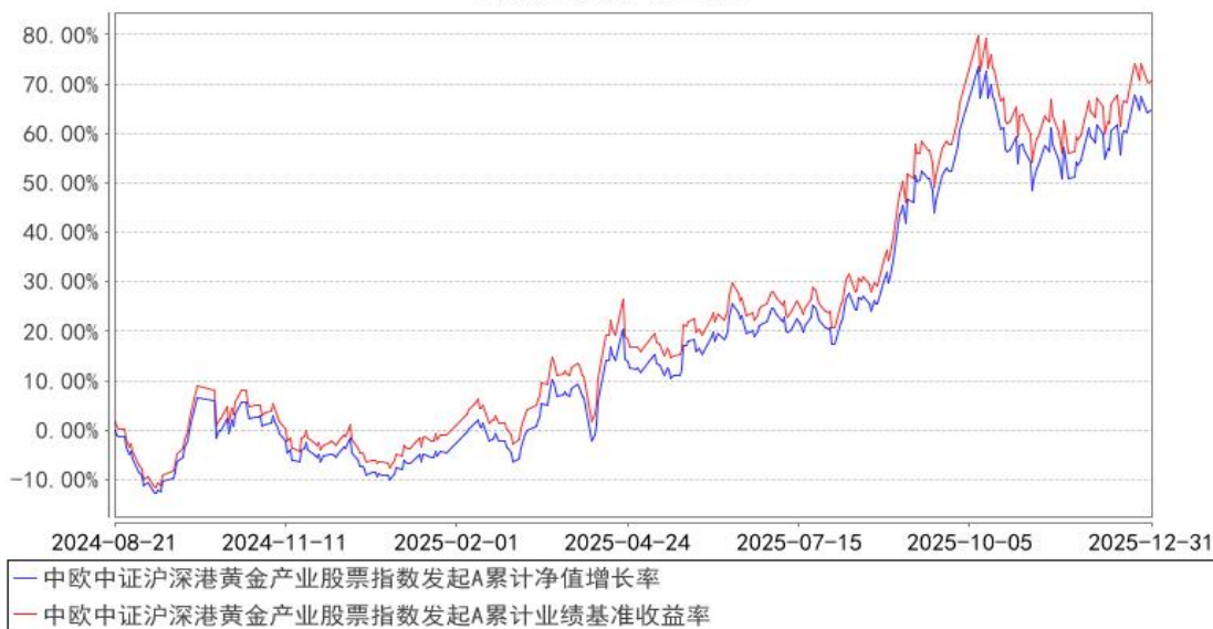
中欧中证沪深港黄金产业股票指数发起A累计净值增长率与同期业绩比较基准收益率的历史走势对比图

注：本基金基金合同生效日期为 2024 年 8 月 21 日，按基金合同的规定，本基金自基金合同生效起六个月为建仓期，建仓期结束时各项资产配置比例已经符合基金合同约定。