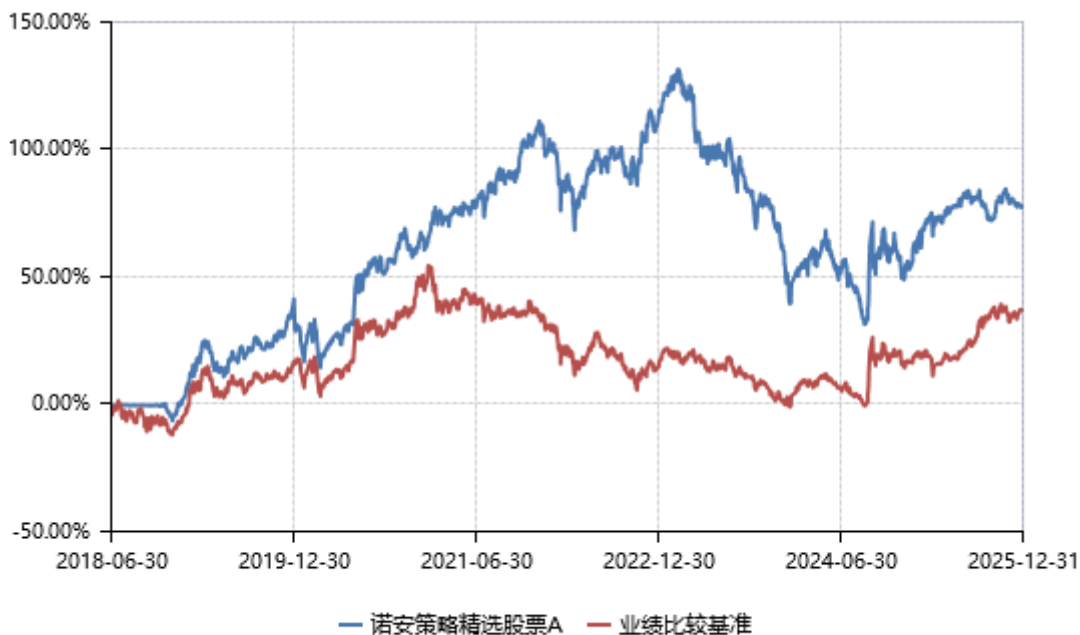
诺安策略精选股票 C