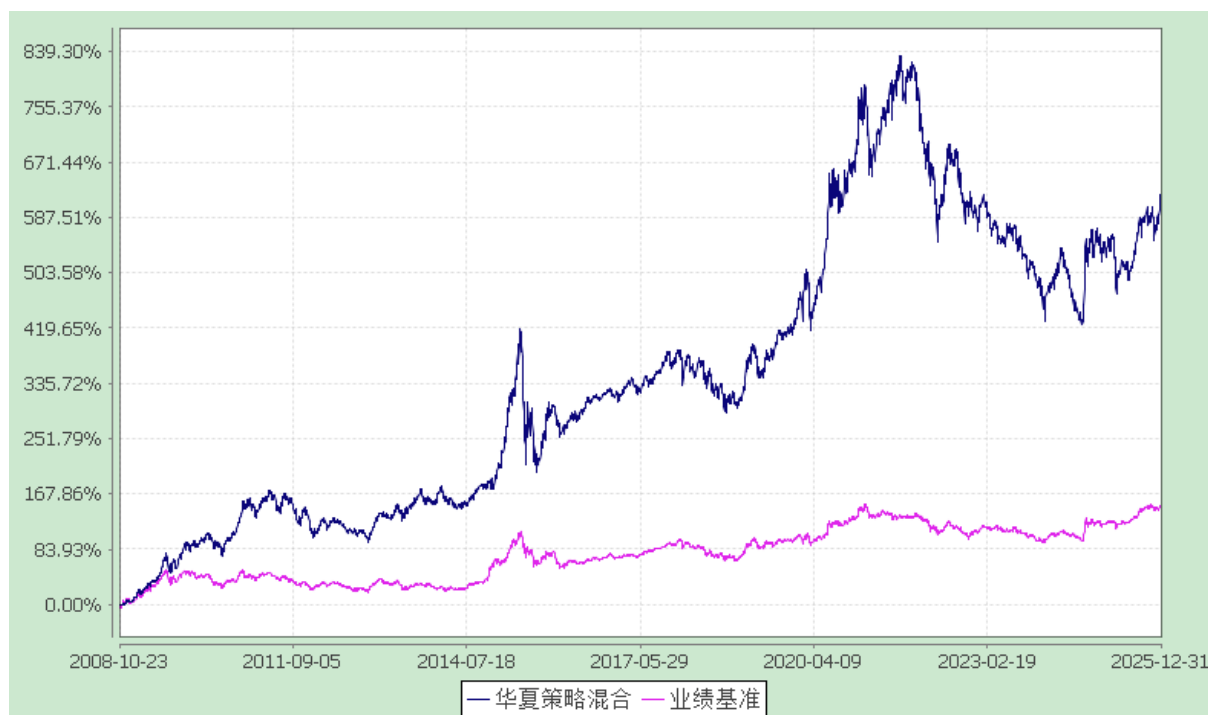
华夏策略精选灵活配置混合型证券投资基金 份额累计净值增长率与业绩比较基准收益率历史走势对比图 (2008年10月23日至2025年12月31日)