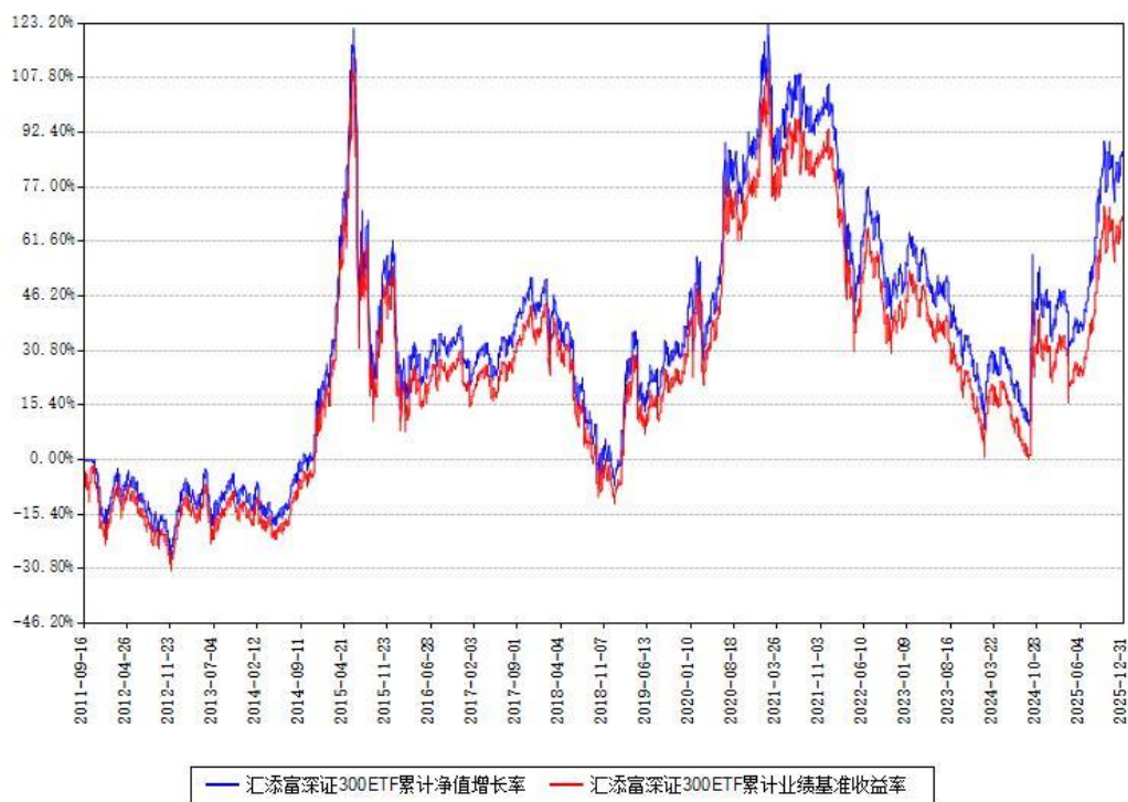
汇添富深证300ETF累计净值增长率与同期业绩基准收益率对比图

注：本基金建仓期为本《基金合同》生效之日（2011年09月16日）起3个月，建仓期结束时各项资产配置比例符合合同约定。