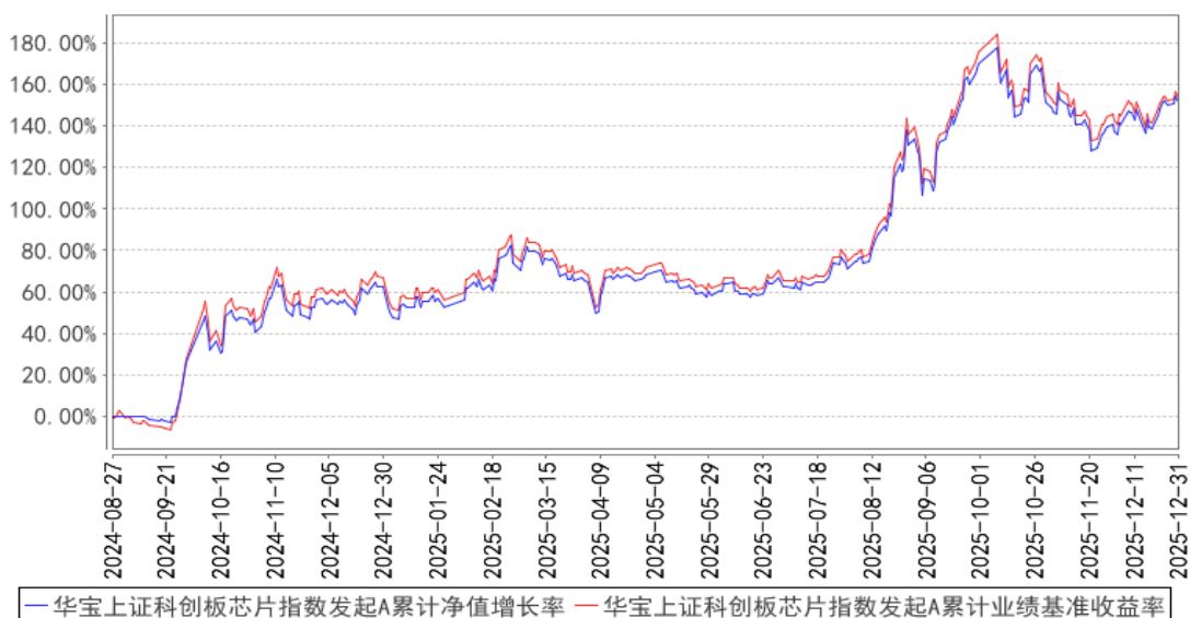
华宝上证科创板芯片指数发起A累计净值增长率与同期业绩比较基准收益率的历史走势对比图