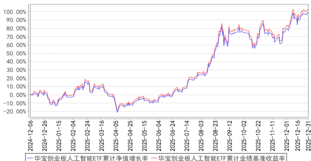
华宝创业板人工智能ETF累计净值增长率与同期业绩比较基准收益率的历史走势对比图

注：按照基金合同的约定，基金管理人应当自基金合同生效之日起 6 个月内使基金的投资组合比例符合基金合同的有关约定，截至 2025 年 06 月 06 日，本基金已达到合同规定的资产配置比例。